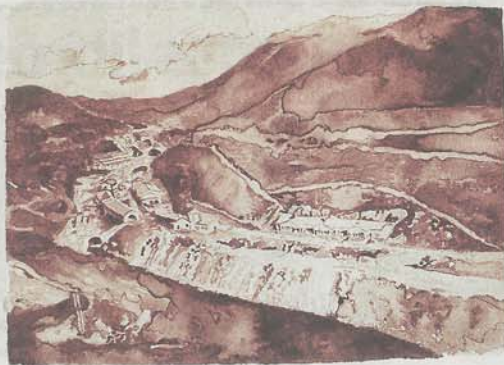
Obra de Javier Arce. 'Engaña #4, 2015'. Sangre del artista sobre papel Hahnemühle. :: SIBONEY