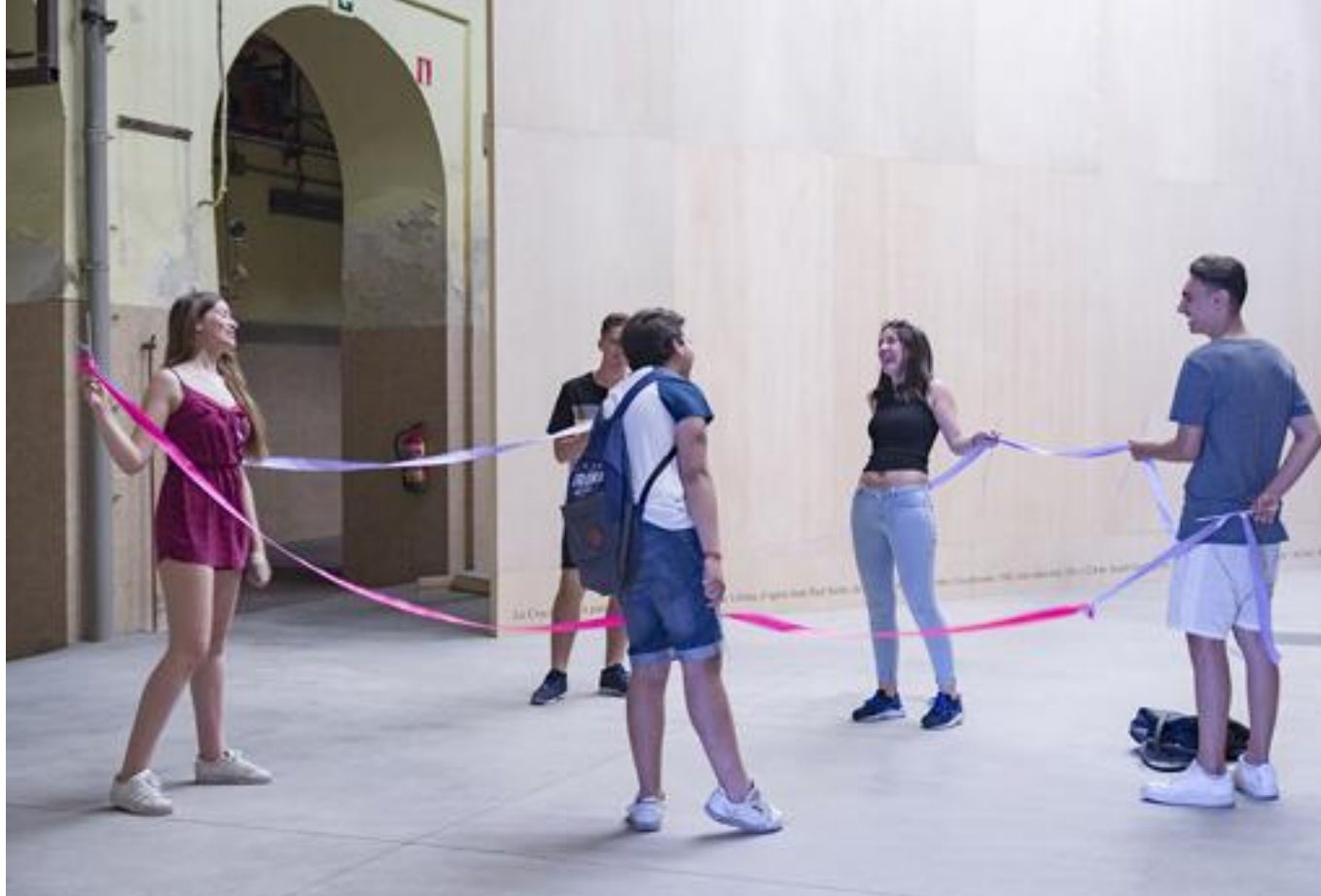
«La casa del guarda». Taller para Tabacalera - C. M.

Su yo «virtual». En redes sociales utilizo Facebook cada vez con menos frecuencia, y tengo una cuenta de Instagram (@crismejias), donde me siento más cómoda. No tengo blog personal, tengo una web con la que me peleo por tener actualizados mis trabajos. Me tira mucho más lo analógico.