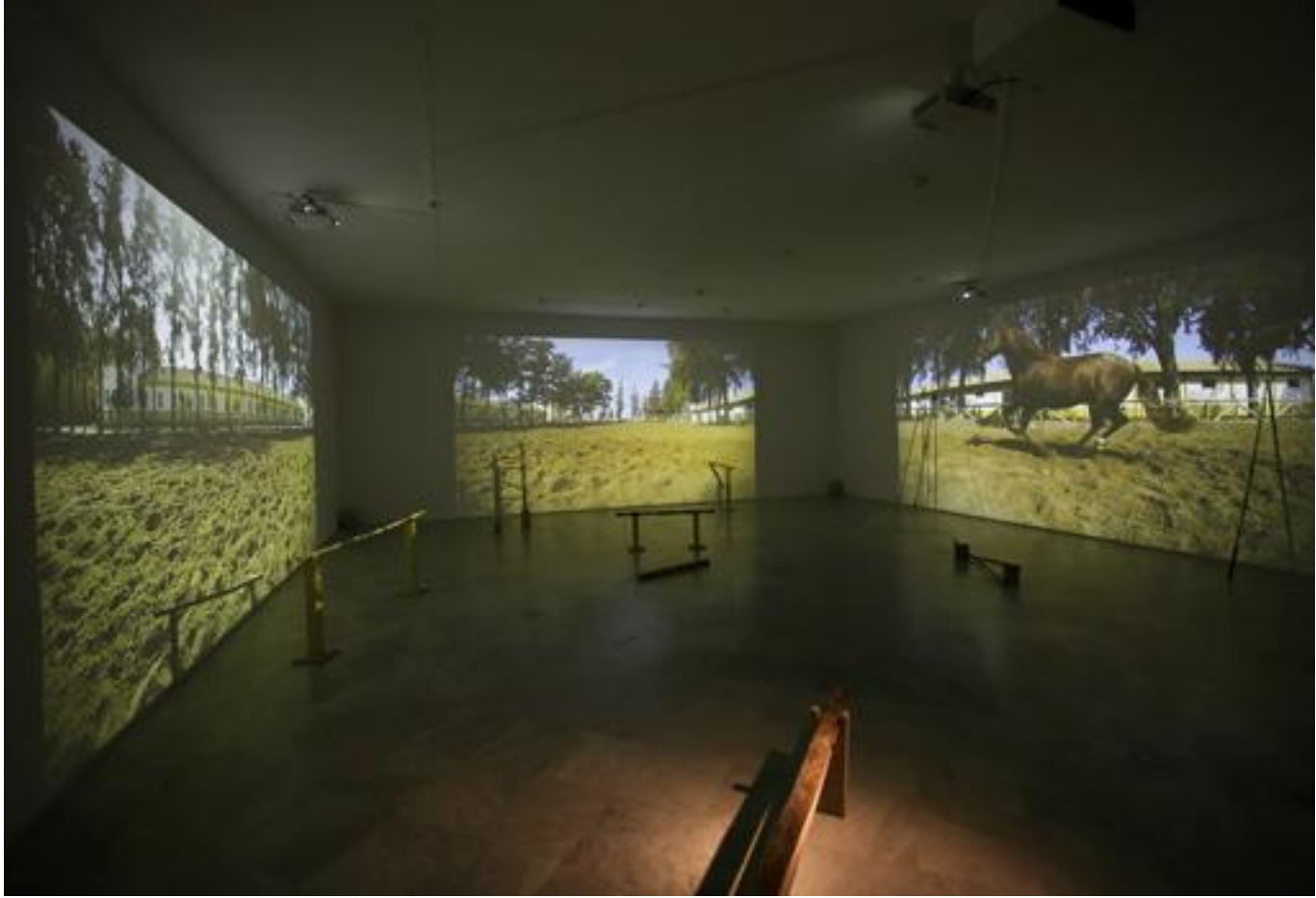
«Tro tro». Montaje para el CAAC - C. M.

Proyecto favorito hasta el momento. Le tengo especial cariño al proyecto «Temps vécu», sobre todo por lo mucho que charlé con mi abuela, porque empezó por ahí, por las historias que me contaba; tenía una memoria bárbara. Pero con el proyecto que desarrollé para el CAAC , «Tro, tro», fue muy gratificante superar los enredos y ver realizada una vídeo-instalación que se me presentaba como lo más complejo que había hecho hasta el momento.