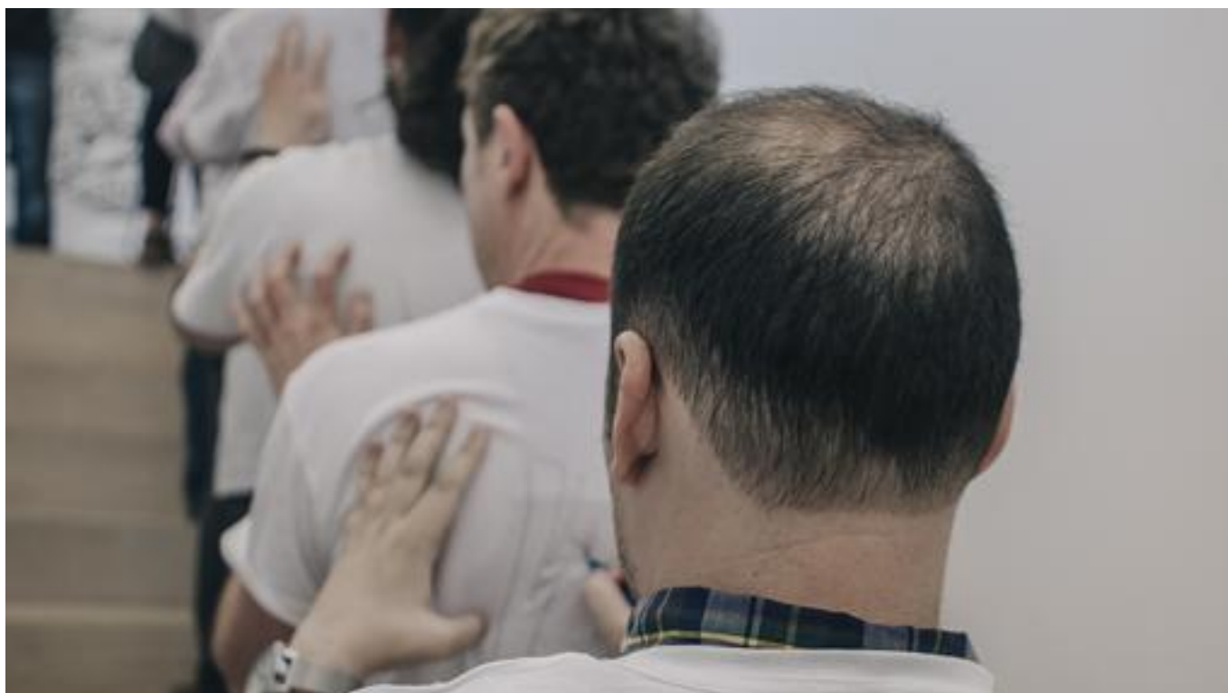
«Twice Upon A Time» (performance) - C. M.

Su yo «virtual». En redes sociales utilizo Facebook cada vez con menos frecuencia, y tengo una cuenta de Instagram (@crismejias), donde me siento más cómoda. No tengo blog personal, tengo una web con la que me peleo por tener actualizados mis trabajos. Me tira mucho más lo analógico.