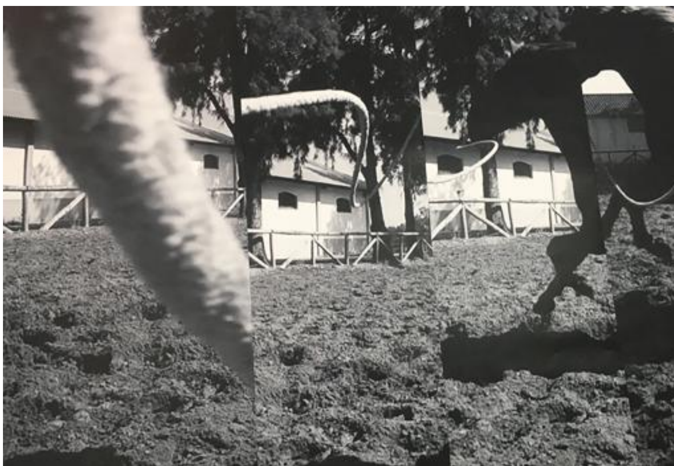
«A Well Known Foreign Echo» - C. M.

Y eso implica procesos de investigación bastante largos, donde normalmente trabajo en un contexto que no me permite meterle prisa. Es importante que así pase. Explorar las posibilidades de contar historias como prólogo para recomponer o inventar otras. Su transmisión, artesanía y afectos. Escribir para aprender a leer. Hacer y conversar, siempre.