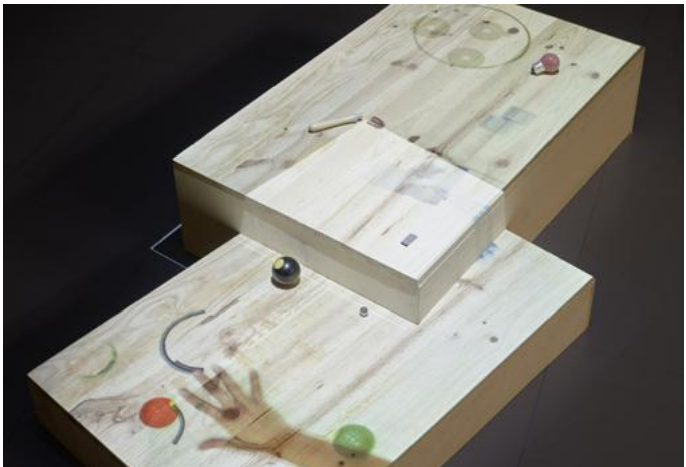
«Twice Upon a Time». Proyecto para la colectiva «Circuitos 2017» - C. M.

Proyecto favorito hasta el momento. Le tengo especial cariño al proyecto «Temps vécu», sobre todo por lo mucho que charlé con mi abuela, porque empezó por ahí, por las historias que me contaba; tenía una memoria bárbara. Pero con el proyecto que desarrollé para el CAAC , «Tro, tro», fue muy gratificante superar los enredos y ver realizada una vídeo-instalación que se me presentaba como lo más complejo que había hecho hasta el momento.