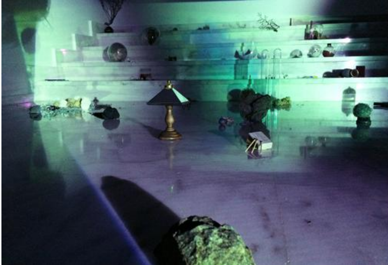
«Tesouro» - C. M.

Qué se trae ahora entre manos. Justo ahora comienzo una residencia en Ranchito ARCOLisboa en Matadero ; empezamos en Madrid, y en abril nos vamos a Lisboa. Tengo intención de continuar trabajando en parte sobre un proyecto que inicié el verano pasado, para el que me incorporé a un equipo de arqueólogos en una excavación en la isla de Gavdos (Grecia) y que continuaré en la residencia de Tabakalera (San Sebastián) a partir del próximo mes de octubre.