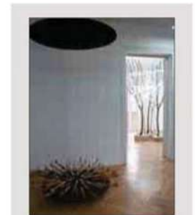
Expositor de Nuble en la feria.